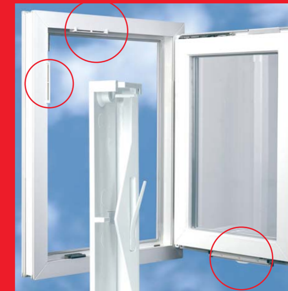
REGEL-air® PLUS mit FL + RF

Die Lust am Lüften – Gesünder wohnen dank REGEL-air®