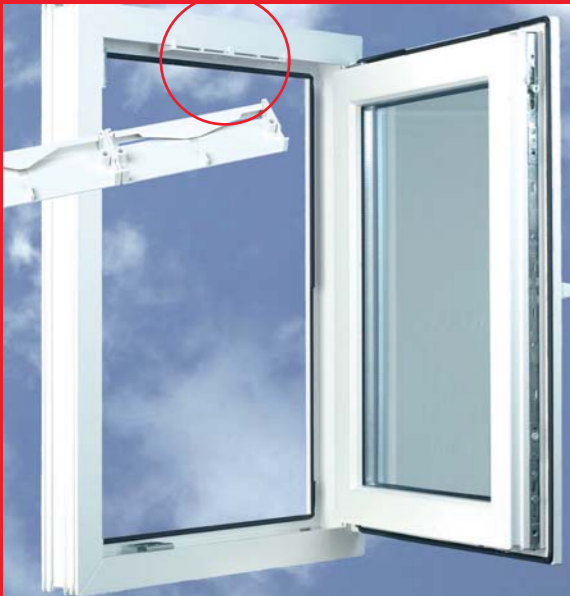
REGEL-air® mit FL